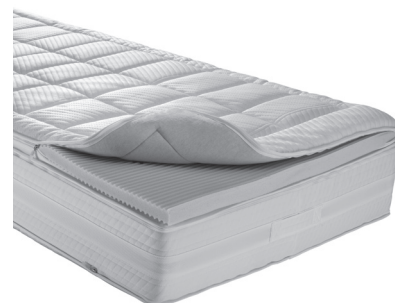
Abb. Ausführung dormabell Innova Air T 20 Top S

Bezug: Drell mit Air-Border 65 % Viskose, 35 % Baumwolle, versteppt mit 500 g/m 2 spezieller Hochflor-Schafschurwolle (100 % Schafschurwolle) + 150 g/m 2 Ingeo (100 % Polylactid), 6 Wendegriffe, drei 4-seitige Reißverschlüsse mit gezähnten Zähnen, Deckblätter getrennt abnehmbar und austauschbar, Einnadelsteppung, reinigungsfähig.