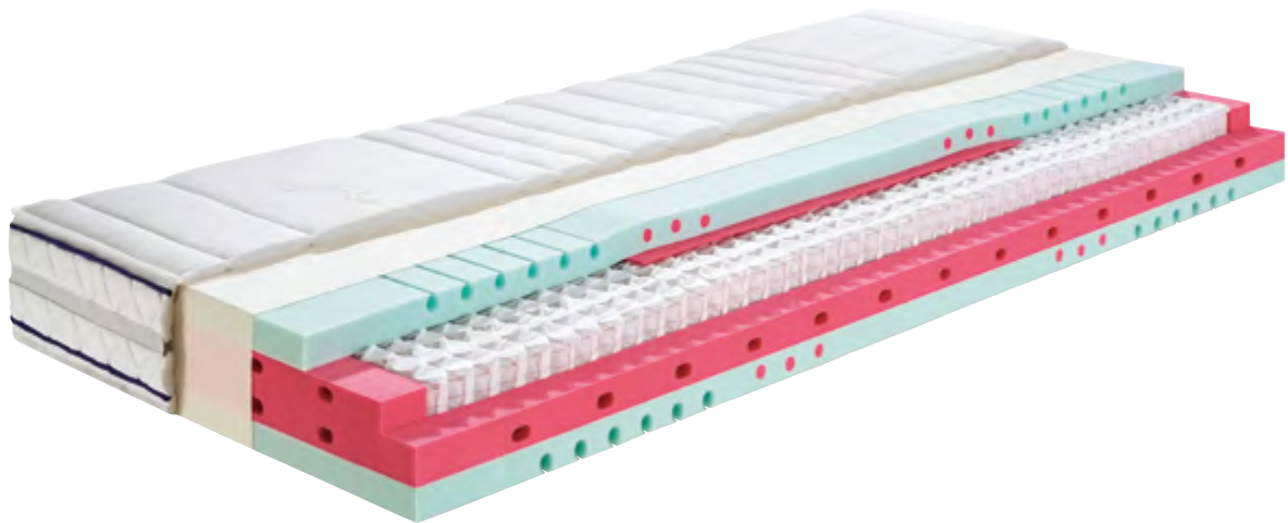
WERKMEISTER M T610 mit Bezug EW 527 BK